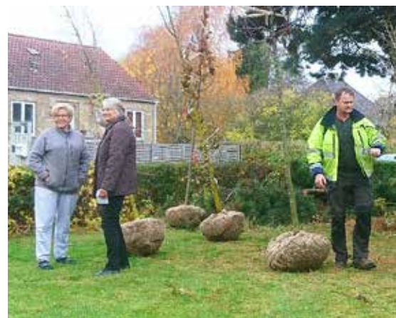
Levering af træer til Vanløse Ny Villakvarter